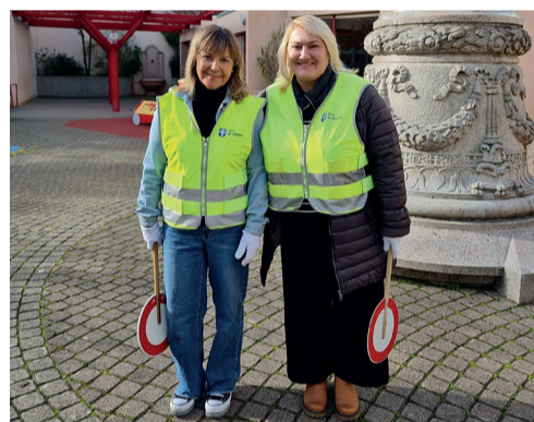
La mise en scène d'un-e patrouilleuse scolaire a été dessinée par les enfants. Vous trouverez leurs créations sur www.versoix.ch .

Un bonjour, un sourire généreux et leurs conseils avisés permettent aux écoliers et parents de débiter la journée en confiance. Le gilet jaune fluo bien visible, la palette à la main et l'œil attentif, un grand merci Mesdames et Messieurs pour votre présence sécurisante et votre remarquable travail !