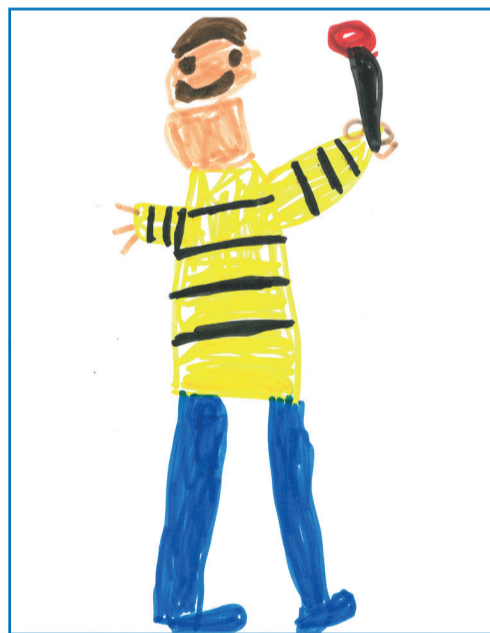
Dessin d'un élève de l'école Lachenal.