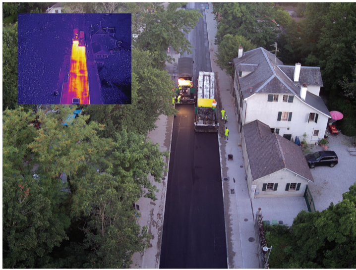
Pose du revêtement phonoabsorbant de nuit sur les phases 1 et 2 (rte de Sauvigny - frontière vaudoise).

Le chantier communal de la place du Bourg a également connu une avancée fulgurante et devrait se terminer au cours de l'automne. Le niveau de la chaussée atteint désormais celui des trottoirs en béton désactivé, en continuité avec ceux de la route de Suisse.