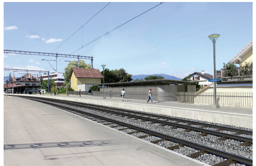
Vue du quai de la gare de Versoix.

Pour plus d'informations : www.cff.ch/travaux