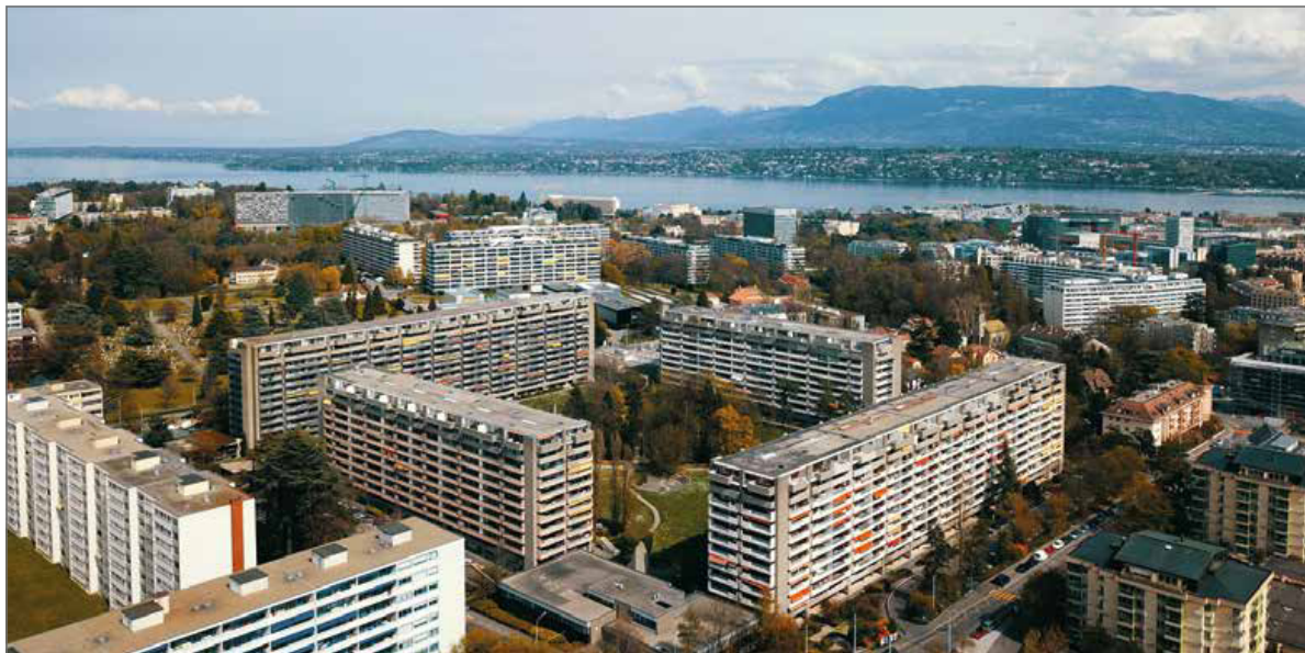
Commune-Rénove concerne avant tout les grands ensembles locatifs construits entre 1945 et 1990.