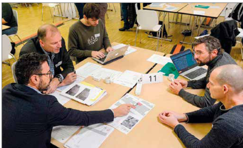
Des ateliers permettent de se déterminer sur la variante qui offre le meilleur rapport qualité-coût-efficacité énergétique.