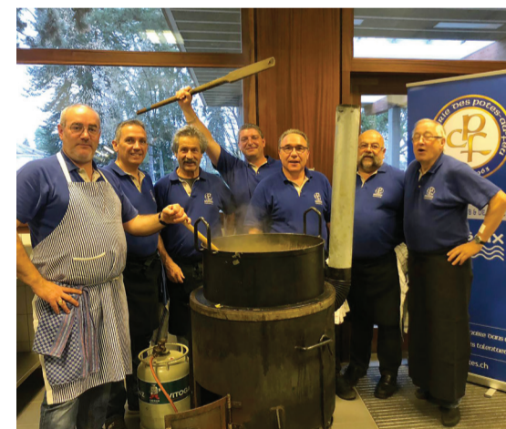
La confrérie des Potes au feu

Il faisait froid dehors mais bon chaud dans la salle communale de Versoix lors de la traditionnelle soupe du 1 er janvier. 180 personnes se sont réunies pour partager un moment chaleureux et gourmand autour des chaudrons des Potes au Feu.